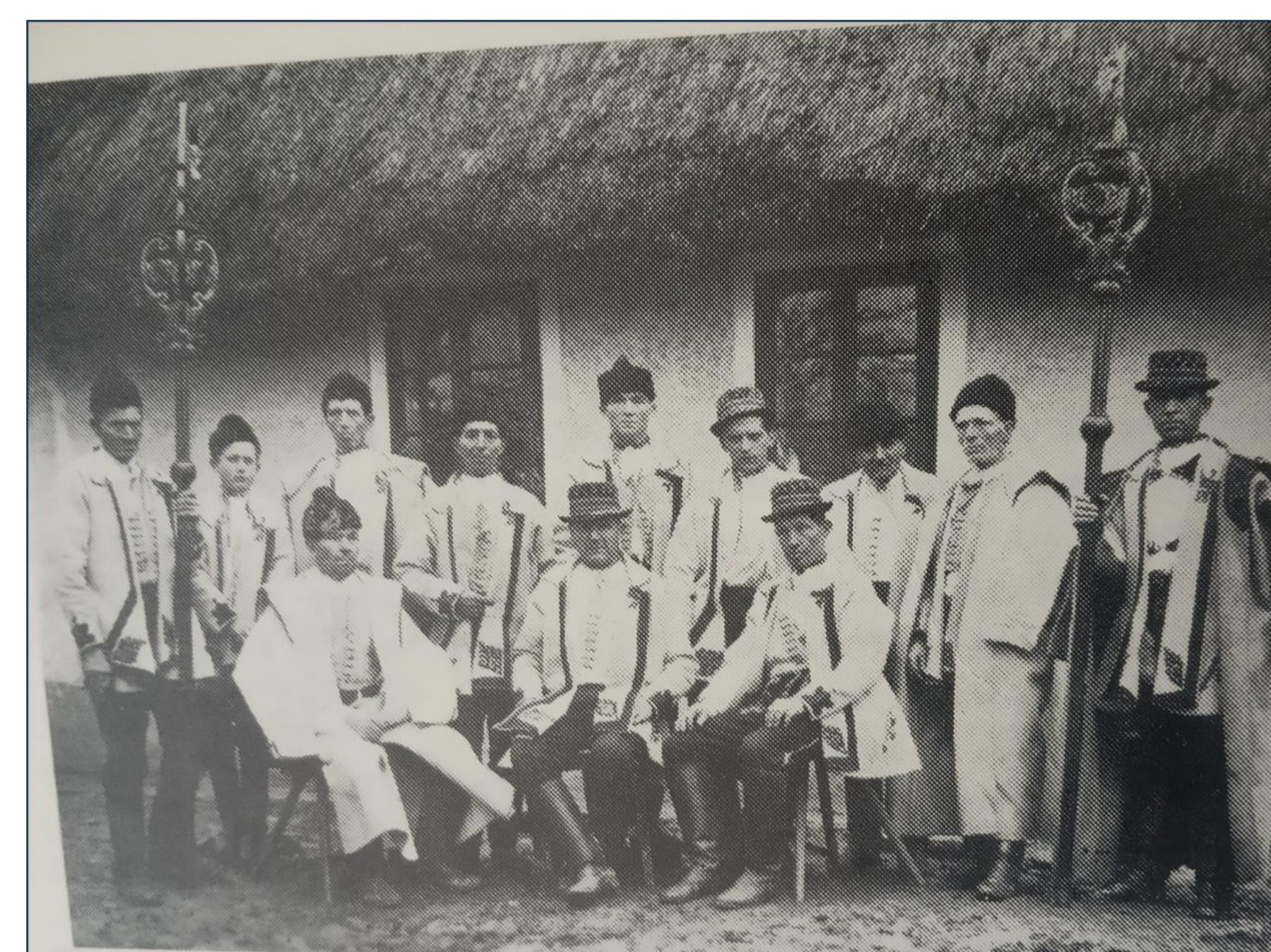
Cechmistři halenářského cechu z Kuželova, sine dato. 3

Další možností pro studium se jeví především ve zbylých částech Slovácka – Podluží a Hanáckého Slovácka.