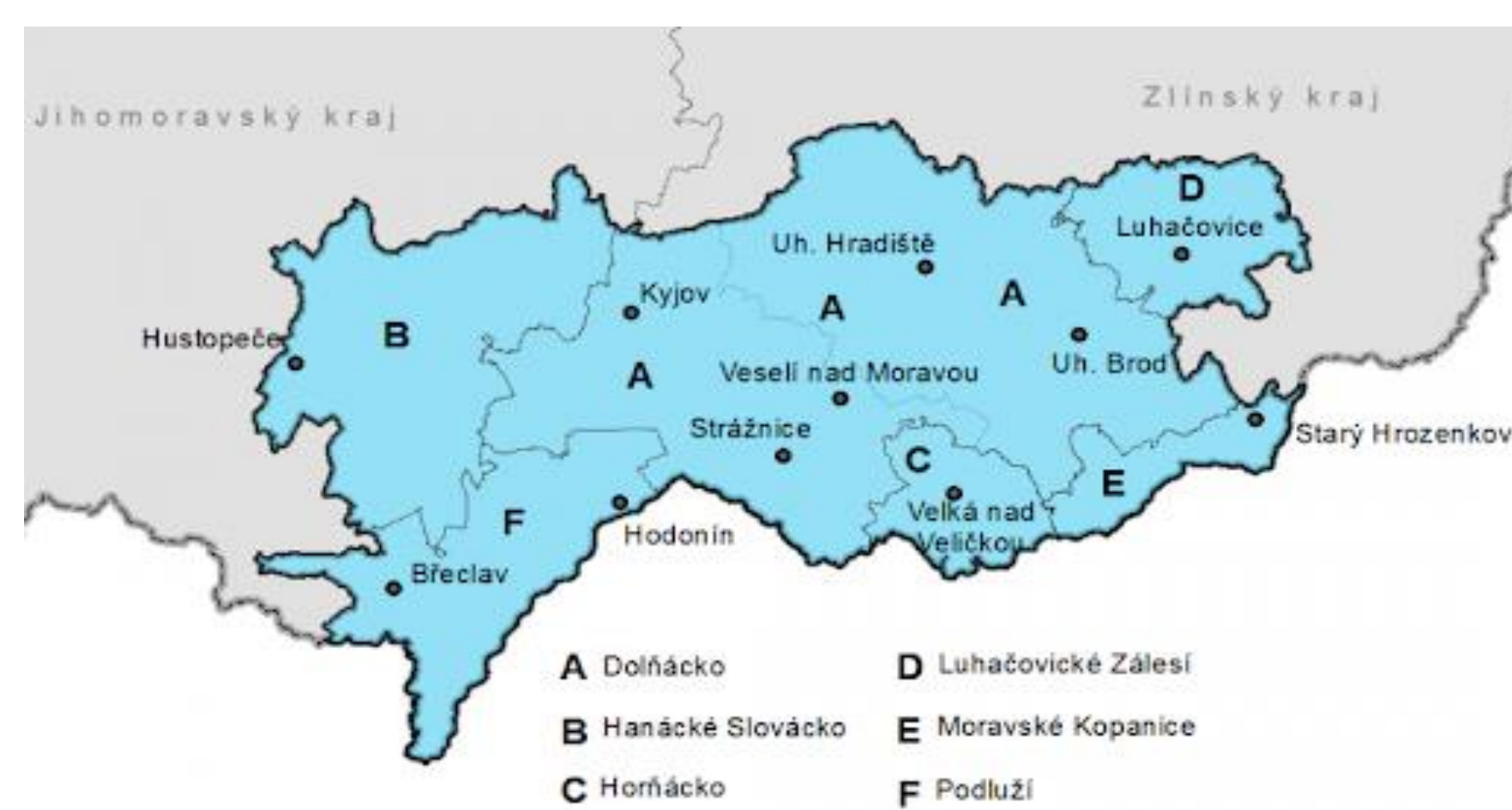
Mapa č.1: Subregiony Slovácka

Zastoupení řemesel je vyjádřeno v tabulce č. 1. Celkem se jedná o 25 různých řemesel sdružených v 68 ceších, ve dvou případech se jednalo o cech vesnický.